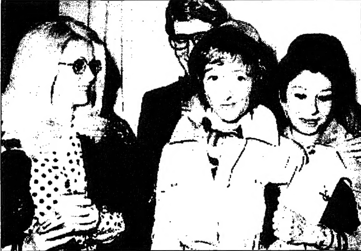
فرانسواز ساغان وفي الاسفل مع كاترين دوتوف